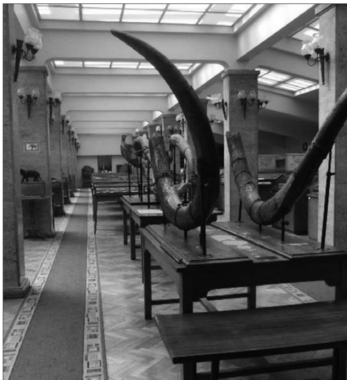
Музей на Софийския университет „Св. Климент Охридски“

вените колекции в българските висши училища не е регистрирана в Министерството на културата по действащия от 2012 г. режим (Наредба № 9), си позволявам известна двойственост на онасловаването, отнасящо се до наименованията на тези специфични структурни звена на българските университети. Описаните в приложената таблица обществени колекции обикновено са именувани музеи, музейни сбирки, музейни колекции . Това терминологично разнообразие е резултат от предпочитанията на съответния принципал. Ползването на тези имена в настоящата статия е израз на уважението ми към ръководните органи на висшите училища, създали и поддържащи деликатните музейни структури в сложните си административни, научни и образователни тела. Споменатият терминологичен жест обаче не negliжира професионалната ми преценка, че според Закона за културното наследство (ЗКН, чл. 109а) визираните обекти са обществени колекции с ведомствен характер, чиято регулация би трябвало да се осъществява както на основа Закона за висшето образование, така и в правната рамка, уреждаща опазването на джизими културни ценности и колекциите с обществено значими вещи и артефакти от миналото. Така, с оглед на представените мотиви и само при анализ на конкретни обекти, допускам ползването на несъществуващата в нормативната уредба терминология музейна сбирка , както и на термина музей , които в тесния правен смисъл не са приложими спрямо нито една от включените в приложената таблица структури .